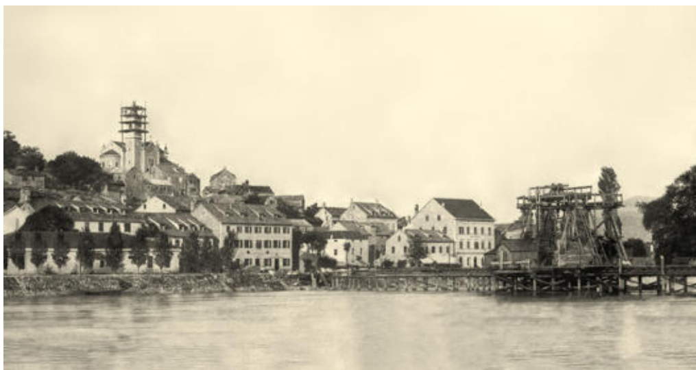
Obnova zvonika 1895. godine

Metkovska crkva sv. Ilije gradila se od 1867. do 1874. godine, s time da je crkva bila pod krovom već 1870. Radovi su nakratko stali 1870. da bi se nastavili 1872. Te godine odbor za gradnju javlja metkovskoj općini da je Vlada odobrila dodatna sredstva za nastavak radova u visini od 4000 forinti. Tom svotom trebao se sagraditi i zvonik. Dana 23. studenoga 1872. održala se javna aukcija za nastavak gradnje crkve i gradnju zvonika za svotu od 4819 forinti, od čega su župljani trebali dati 670 forinti. Koliko je stajala izgradnja samog zvonika, nepoznato nam je jer su sredstva odobrena i za crkvu i za zvonik.