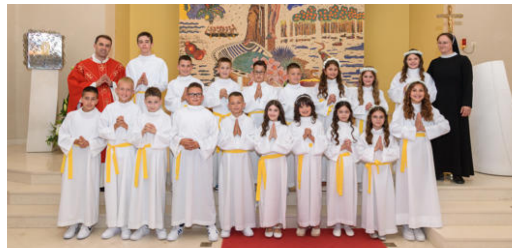
Prva sveta pričest u crkvi sv. Franje